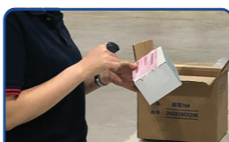
电商仓库-打包复核